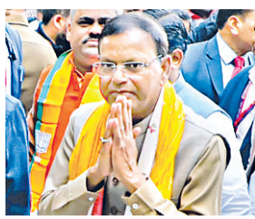
केंद्रीय वित्त राज्य मंत्री पंकज चौधरी।

● निर्विरोध चुना जाना तय, केंद्रीय चुनाव अधिकारी पीयूष गोयल आज करेंगे औपचारिक घोषणा